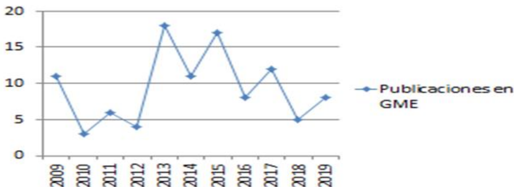
Chart 1. Trend in scientific publications by Stomatology professors in the GME. 2009-2019 period.

Stomatology research in Sancti Spíritus province shows important progress in the last decade and for the publication of its scientific results, the Gaceta Médica Espirituana (GME), a journal certified by Citma resolution since 2009, has played an important role, (1) it belongs to Group II, according to the regulations of the Ministry of Higher Education; (2) for being indexed in: Cumed , Red de la Ciencia cubana , Lilacs , Latindex , Medigraph , Ebsco , e-Journals [REDIB (Red Iberoamericana de Innovación y Conocimiento Científico)] , MIAR , Actualidad Iberoamericana , CiteFactor , Science Library Index , Scientific Indexing Services , WorldCat , Directory of Research Journals Indexing , SciELO and DOAJ . It is therefore necessary to determine the trend of the scientific publications by Stomatology professors in this journal.