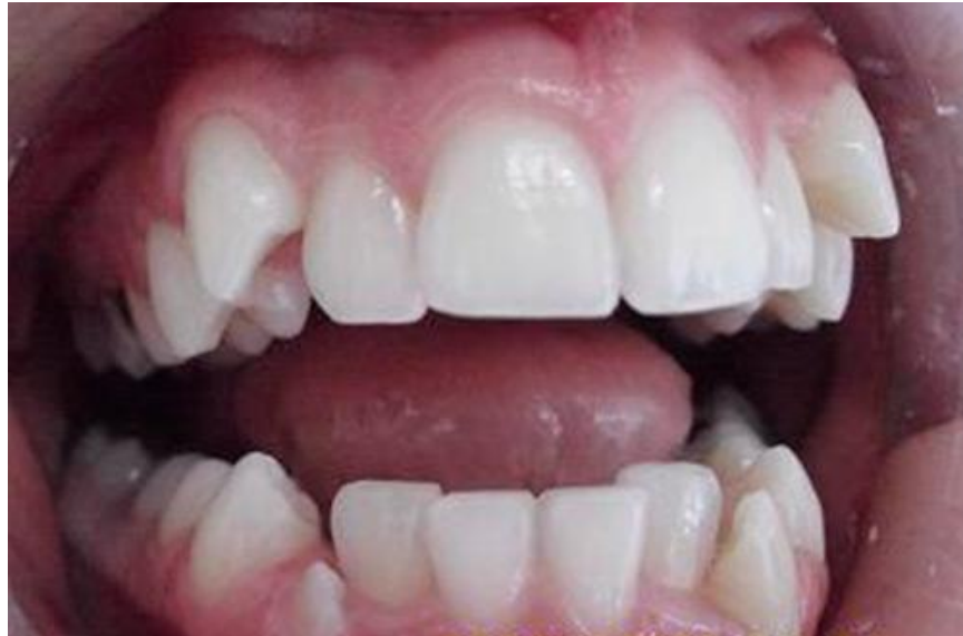
Características clínicas del paciente

Datos positivos al examen físico: perfil recto y buen balance neuromuscular. En ambos maxilares presenta dentición permanente de segundo molar izquierdo a segundo molar derecho, apiñamiento anterior, caninos en vestíbulo egresión, linguoversión y rotación de incisivos laterales. Caries extensa de primer molar superior derecho con muerte pulpar y pulpotomía realizada en primer molar inferior derecho. (Fig 1)