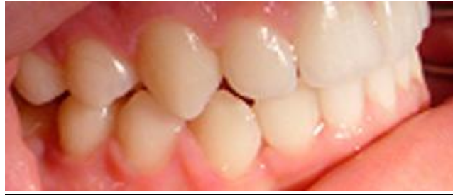
Etapa de contención de los resultados

Una vez culminada la etapa activa de movimiento, comenzó la etapa de contención con aparato removible tipo Hawley en el maxilar superior y arco de contención cementado de lingual de canino a canino en el maxilar inferior.