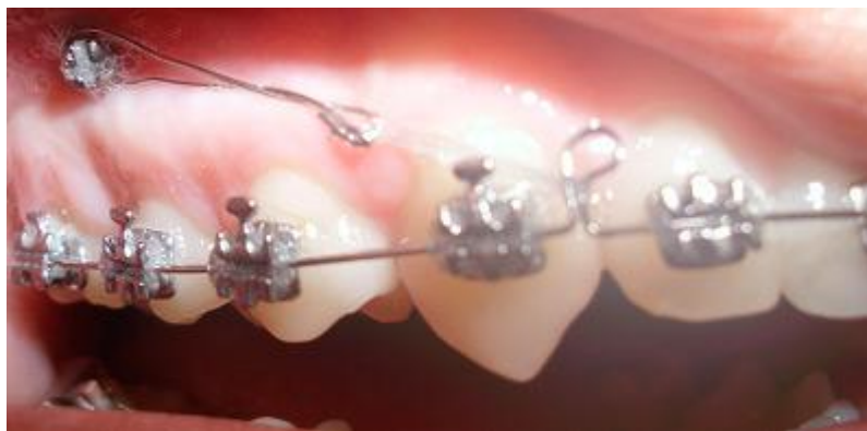
Aplicación de fuerza desde el mini implante

Evolución: se comenzó la aplicación de la fuerza al mes de colocar los mini implantes con el uso de retroligaduras activas (expansión del elastómero hasta el doble de su diámetro y cambio cada 21 días) hasta culminar los movimientos en masa de los dientes (Fig 7). Durante este período no existió dolor, inflamación u otra lesión en la zona peri implantaria.