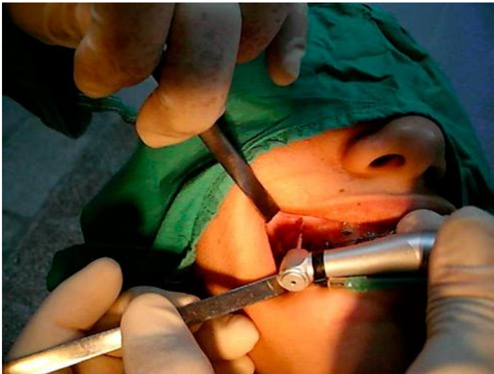
Fresado del hueso cortical