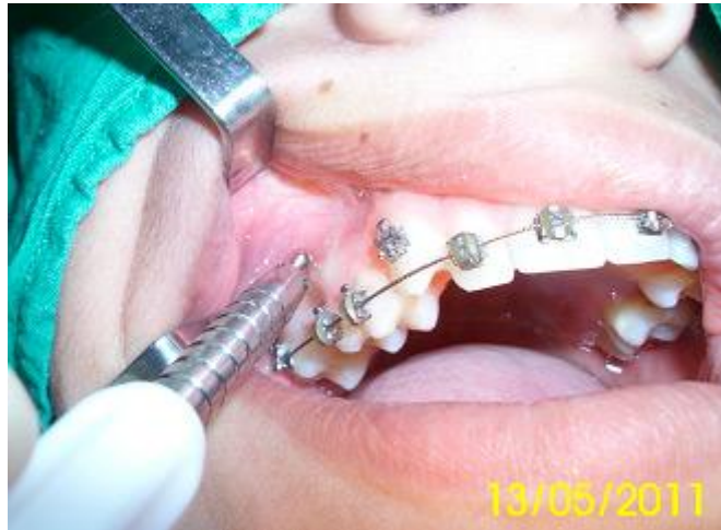
Inserción manual del mini implante

Evolución: se comenzó la aplicación de la fuerza al mes de colocar los mini implantes con el uso de retroligaduras activas (expansión del elastómero hasta el doble de su diámetro y cambio cada 21 días) hasta culminar los movimientos en masa de los dientes (Fig 7). Durante este período no existió dolor, inflamación u otra lesión en la zona peri implantaria.