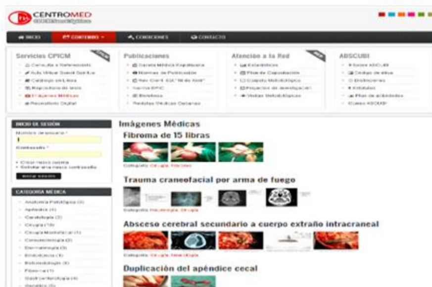
Galería de Imágenes. http://www.ssp.sld.cu/?q=galeria_medica